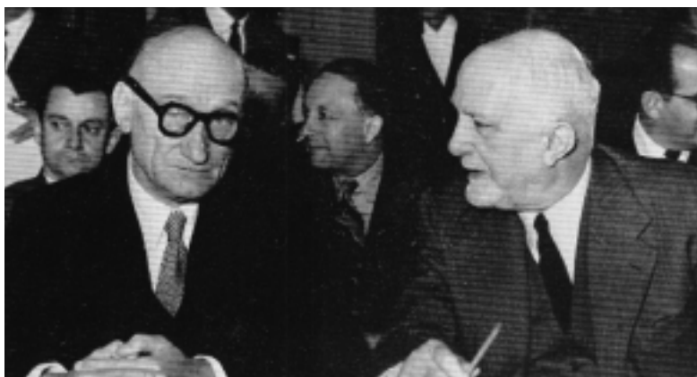
Robert Schuman et Carlo Sforza

Les délégations des pays du Bénélux opposèrent des critiques fondamentales aux structures institutionnelles prévues pour la Communau-