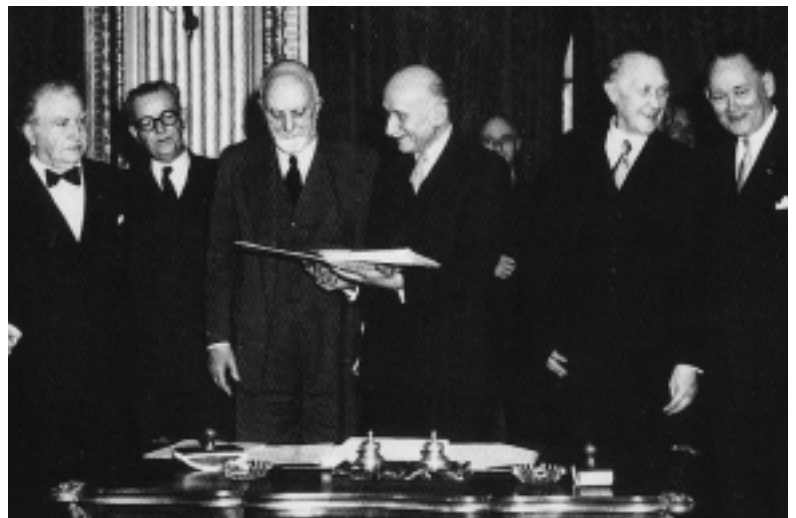
La signature du Traité de Paris instituant la C.E.C.A

Robert Schuman depuis des années se posait de lancinantes questions sur la manière de résoudre le «problème allemand». Dans le climat de peur engendré par la «Guerre froide», le statut de la République fédérale d’Allemagne devenait un enjeu