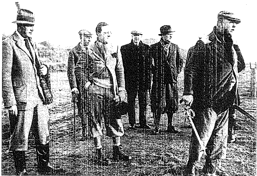
De adel op jacht. Een van de jagers is prins Bernhard (vooraan, midden).

In mijn oratie De maatschappelijke relevantie van hedendaagse Nederlandse adel (Amsterdam, Vossiuspers, AUP, 2000) liet ik zien dat de Nederlandse adel meer is dan een 'historisch instituut', zoals bijna alle politici bij de behandeling van de nieuwe adelswet hebben beweerd. Uit de door mij gepresenteerde analyses bleek duidelijk dat de Nederlandse adel ook gedurende