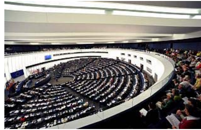
Los diputados del Parlamento Europeo votan durante una sesión plenaria en Estrasburgo.

Más controlados que nunca. Internet y la labor de varias organizaciones han hecho posible que los ciudadanos lo sepan casi todo sobre el trabajo de los eurodiputados que buscan la reelección en las elecciones europeas. ¿Faltan a menudo a los plenos? ¿En cuántos informes han trabajado? ¿Qué han votado sobre determinado asunto? Preguntas que hasta ahora tenían difícil respuesta y que varias webs pretenden resolver. 'VoteWatch.eu' es una que recoge todo tipo de estadísticas sobre el trabajo de los eurodiputados