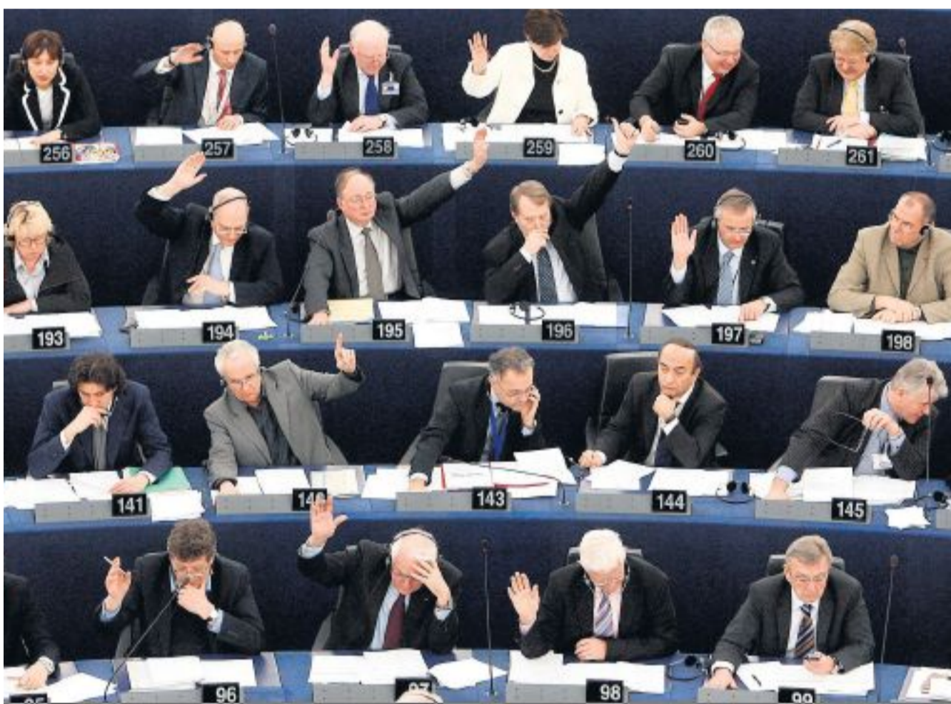
Abstimmung im Europaparlament in Strassburg: Die Abgeordneten drücken jedem EU-Entscheid den Stempel auf.