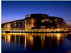
Jos Lissabonin sopimus astuu voimaan, se vahvistaa edelleen Euroopan parlamentin institutionaalista asemaa ja poliittista roolia.

Euroopan parlamentti on EU-jäsenmaista koostuvan neuvoston ohella keskeinen lainsäätäjä. Parlamentilla on laajat budjettivaltuudet ja se valvoo EU:n toimielinten toimintaa.