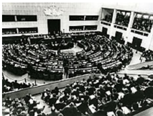
Euroopan parlamentaarinen kokous piti järjestäytymisistuntonsa Strasbourginissa 19.3.1958.

Parlamentti oli alussa pelkkä keskustelufoorumi, jolla ei juurikaan ollut valtaa. Sittemmin parlamentti on muuttunut huomattavasti pääasiassa laajentumisen myötä. Jäsenmaiden määrä on kasvanut kuudesta 27:ään, edustajien määrä 142:sta 785:een ja kielten määrä neljästä 23:een. Parlamentin lainsäädäntävalta on kasvanut 1990-luvulta lähtien perussopimusten myötä.