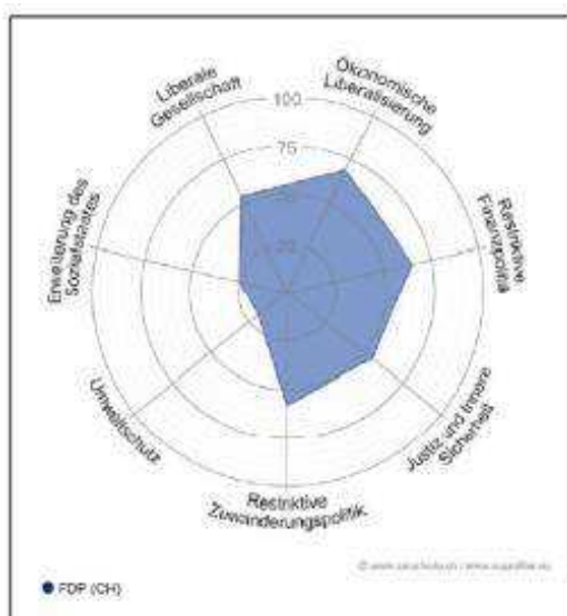
Spider-Grafik aus der Schweiz: Hier das Profil der Schweizer FDP...