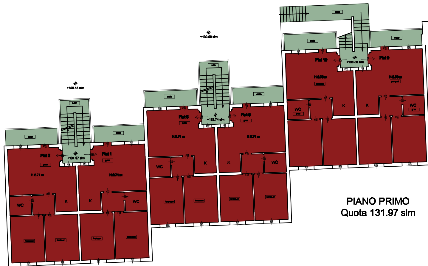
PIANO PRIMO Quota 131.97 slm