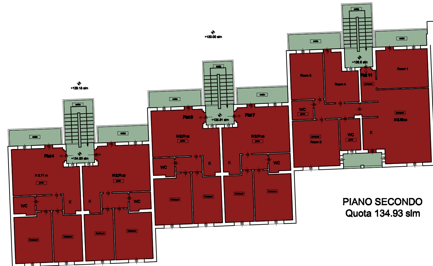
PIANO SECONDO Quota 134.93 slm