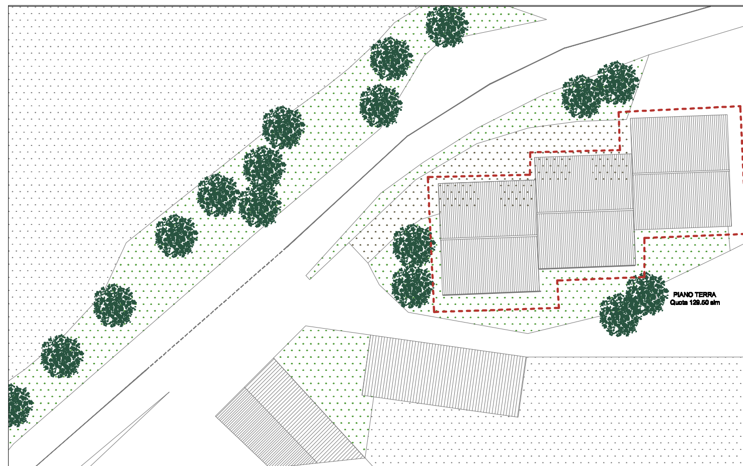
PLANIMETRIA ESTERNO Scala 1:500