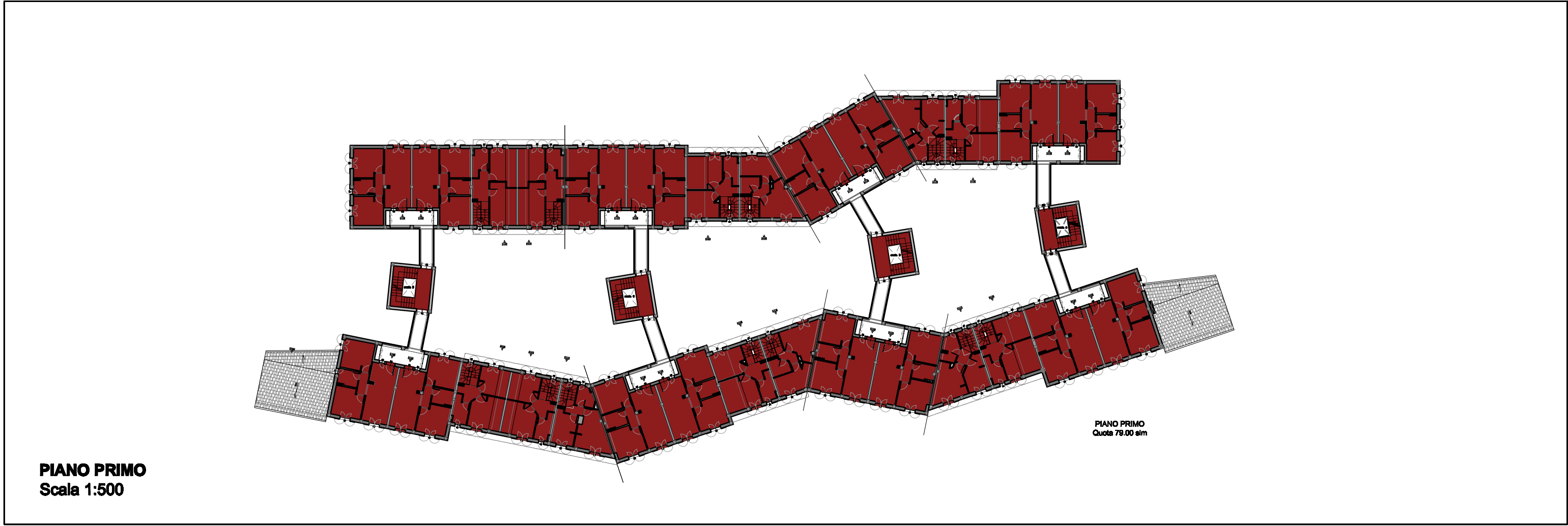
PIANO PRIMO Scala 1:500