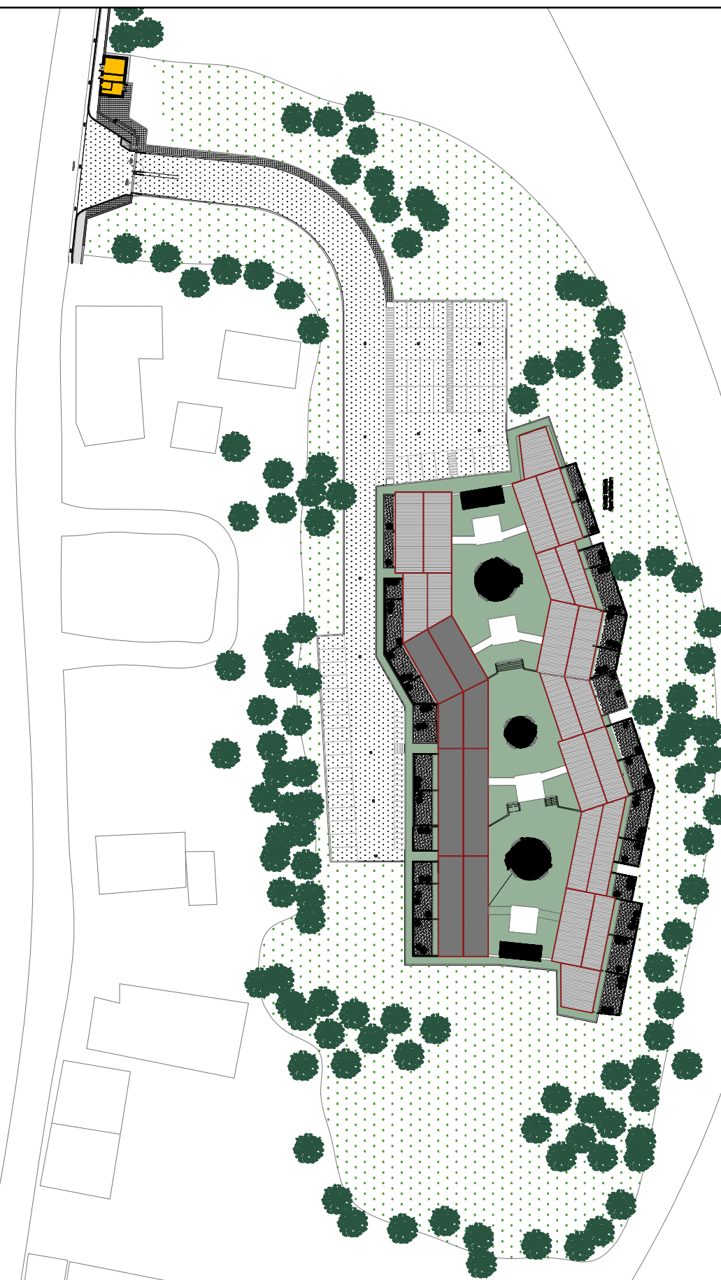
PLANIMETRIA ESTERNO Scala 1:1000