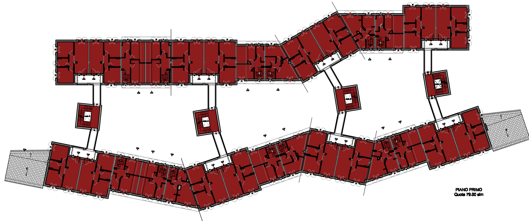
PIANO PRIMO Quota 79.00 slm