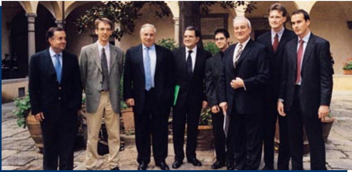
Les lauréats du Prix BP avec Peter Sutherland, Romano Prodi (centre) et Patrick Masterson